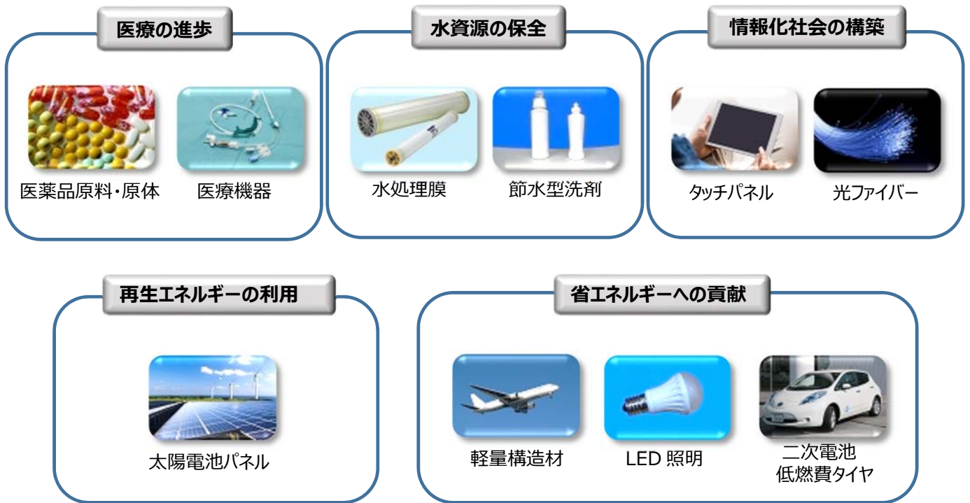
参考図 2 レスポンシブル・ケア®活動の概念