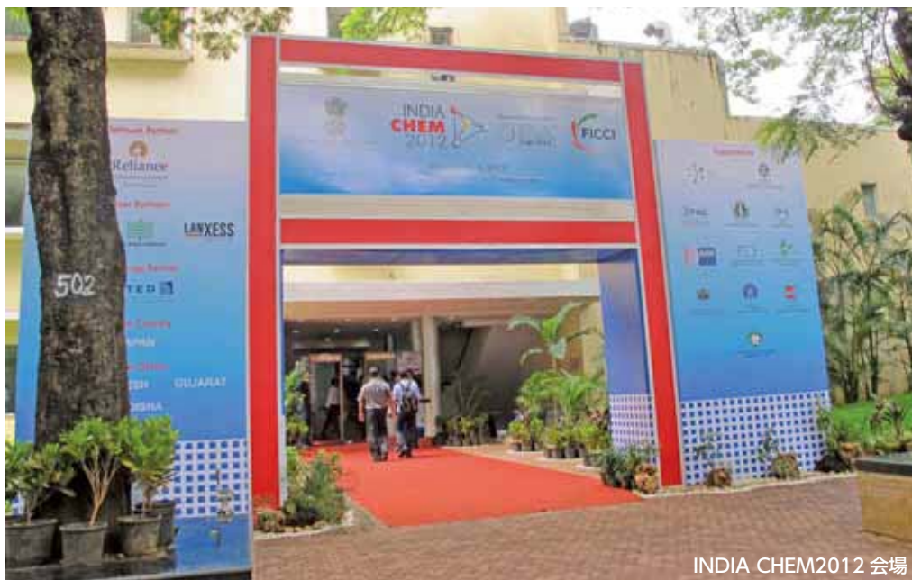
INDIA CHEM2012 会場

インド最大級のケミカル及びペトロケミカル総合展示会 INDIA CHEM 2012 が、10月4日～6日の間、インドのムンバイで開催されました。