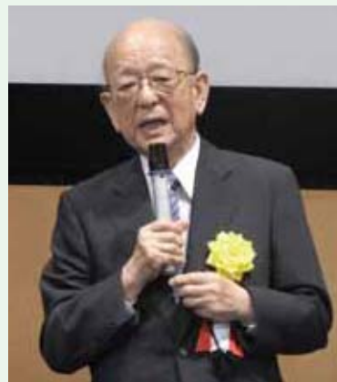
鈴木章北海道大学名誉教授

今年7月、ロンドン五輪より一足先にアメリカで開催された「国際化学オリンピック」。今年は世界72カ国・地域から283名の高校生が出場しましたが、日本代表は1名が2年連続出場で金、1名が実験試験1位で金、残りの2名も銀と4名全員がメダル獲得という輝かしい成績を収めました。報告会では、試験やエキスカージョンの様子が写真付きで紹介され、代表からは「英語だけではなく、けん玉や折り紙などを通じて、海外の代表と交流したことは貴重な体験となった」とコメントをいただきました。来年はロシア大会ですが、日本代表は今回の化学グランプリで優秀な成績を収めた生徒を中心に選定されます。