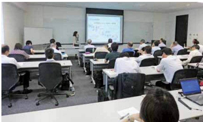
講義（織朱實関東学院大学教授）