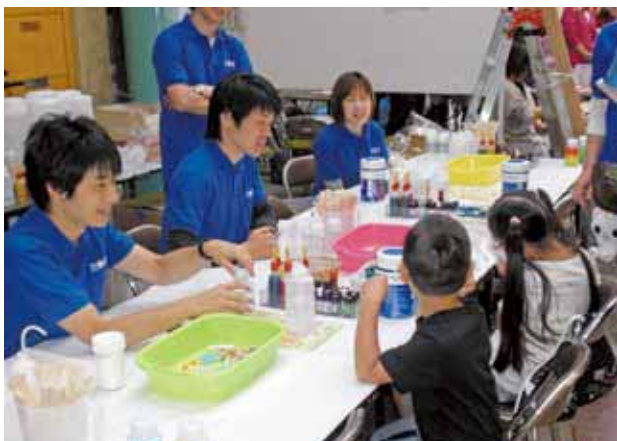
地域貢献の一環として毎年開催されている出張化学実験教室 (黒崎事業所)

唐津 西から黒崎・水島・坂出・四日市・鹿島の 5 事業所が大きな拠点ですね。他にやや小規模な工場が小田原・筑波・直江津にあります。研究開発は横浜と筑波で行っていますが、