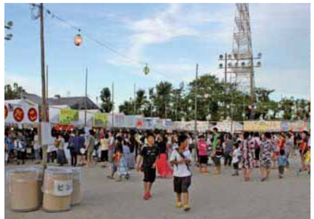
地域との交流を深める納涼祭（四日市事業所）

唐津 JRCCとの完全統合に伴い、これまでの様々な活動を一元化し、より判り易い情報の発信をお願いしたいですね。