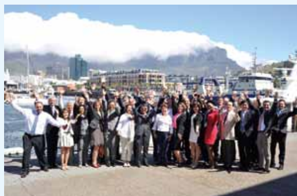
参加メンバーの集合写真