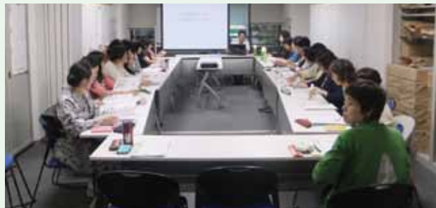
9月27日 全国消費生活相談員協会にて

化学製品PL相談センターに寄せられた相談事例をもとに、化学製品による事故を防ぐための生活上の注意点等についてお話しています。