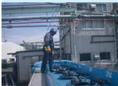
落下事故防止用フルボディーハーネス

2008年にOHSAS18001の認証を取得したのに加え、クローダインターナショナル独自のより厳しい要求事項を満足するようにマネジメントシステムを構築しています。安全面ではゼロ災害達成のために、軽微災害以上の全ての事故に対してクローダが推奨する根本原因分析ツール(Event Causal Factor Analysis)を用いて具体的な再発防止策を策定しています。更に、原因分析の結果をマネジメント