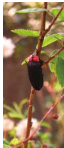
守山工場 ビオトープ