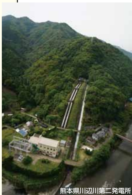
熊本県川辺川第二発電所

木庭 JRCCの発足と同時に加入したので、もう20年になるんですね。当社では1973年に市原製造所で爆発事故が発生し、それを教訓として特に安全には力を注ぎました。安全とは順位付けをするものではないという考えから、「安全第一」ではなく「安全常に」を合言葉に活動を展開しており、新入社員にも最初に説明します。環境については、新製品開発等、何かを始める時には必ず環境影響を精査するという姿勢で臨んできました。