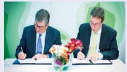
Letter of Intentへの署名

これらにより、化学産業としてのSAICMや持続的発展に向けた貢献について議論され化学産業のソリューションプロバイダーとしての認識がさらに深まりました。