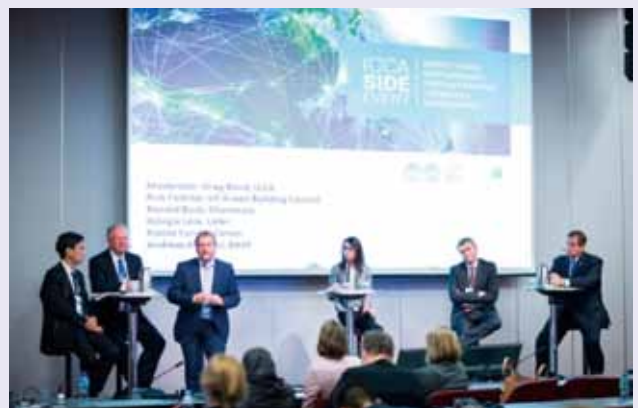
化学物質情報伝達システムchemSHERPAの紹介

ICCM5に関しては2020年に開催される予定ですが、開催地については現時点では未定です。なおICCM4会議文書:議題、会議文書等は以下のウェブサイトから入手可能です。