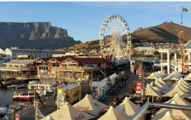
会場となった Victoria & Alfred Waterfront (背景は左がテーブルマウンテン、右がシグナルヒル)

なお、来年度のRCLG会議は2016年4月に米国マイアミ、2016年秋にはブラジルのリオ・デ・ジャネイロで開催される予定です。