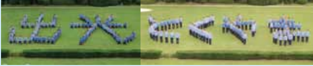
事務所発足のひとと文字

出光は、現在、全国4ヵ所(北海道、千葉、愛知、徳山)に3製油所・1工場・1事業所を配置しており、石油製品、石油化学製品を生産し、これらの安定供給を図っています。出光徳山は、2014年3月に原油処理機能を停止したことに伴い、徳山製油所と徳山工場を統合し、『徳山事業所』として周南コンビナート全体の競争力強化に向け新たなスタートを切りました。徳山事業所ではナフサ、LPガスを原料にエチレン、プロピレンをはじめ、パラキシレン、スチレンモノマーなど各種石油化学製品を生産しており、コンビナート各社に原材料を供給する拠点として、今後も安全・安定供給に努めて参ります。