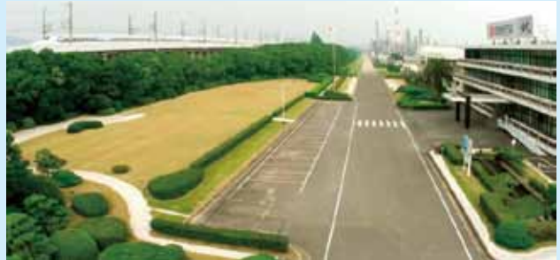
緑豊かな公園工場

れは公害対策基本法が公布される10年前のことで、わが国の工場における緑化や美化に先鞭をつけました。また、ガソリン中の有害物質であるベンゼンの低減や、ディーゼル車の排ガス対策として必要な軽油の低硫黄化など、常に時代を先取りした環境対策を実施してきました。環境保全の具体的な取り組みとしては、環境マネジメントシステムを有効に活用して、「省エネルギー」「廃棄物削減」「PCB廃棄物の保管・処理」「PRTR物質の削減」等の課題に積極的に挑戦し大きな成果をあげています。21世紀は「環境の世紀」と言われており、出光はこれからも自然環境との調和を大切にしながら環境保全に努めます。